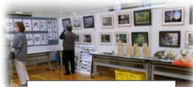
体育室での展示の様子