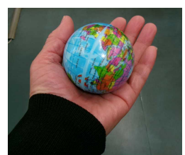
11月21日(金)今日から始める認知症予防講座 握力を付けることも大切なことだそうです。握力トレーニングボールをいただきました。