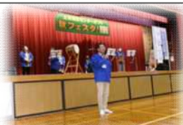
蘇南中学吹奏楽部の皆さん