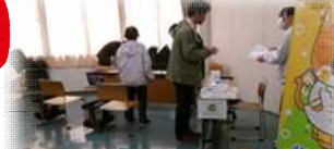
骨密度や血管年齢を調べてもらいました