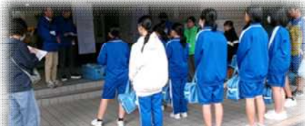
蘇南中学のボランティアの皆さん