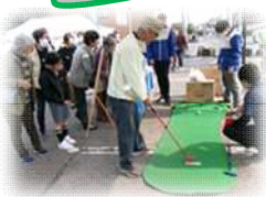
外会場にもにぎわいました

前日の雨も上がり晴天での開催となりました。たいへん多くの人に来ていただきとてもにぎやかでした。準備から片付けまでスタッフの皆さん大変お疲れさまでした。ありがとうございました。