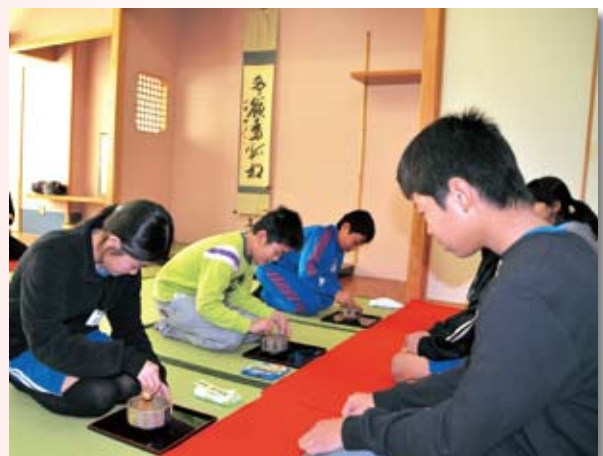
心を込めてお茶を点てる児童

この取り組みは、地域の伝統文化である陶芸と茶の湯を通したふるさと教育の一環として毎年行っています。その実績が評価されて、11月には岐阜県ユネスコ協会より青少年グランプリ賞（文化賞）を受賞しました。学校はもとより、地域の大きな自信と喜びとなっています。地域の伝統文化を学校教育に生かすことで、子どもたちの豊かな人間性を育てていきます。