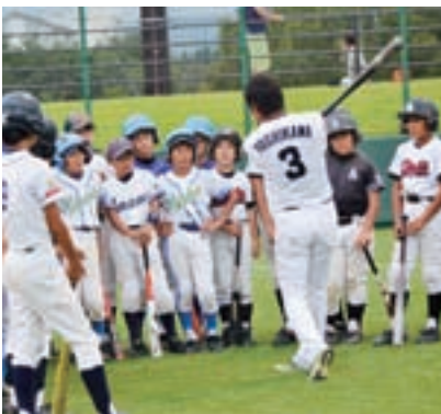
昨年開催された公式戦後の野球教室

可児市内で開催されるイベントをもっともっと多くの市民に知ってもらい、楽しんで欲しい。そして、その情報が広がって、市外か