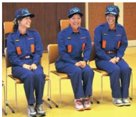
入団式後の懇談会で盛り上がる女性団員

・操法大会 大会のみではなく、子連れが楽しめるようなブースやイベントも開催したらどうでしょうか。