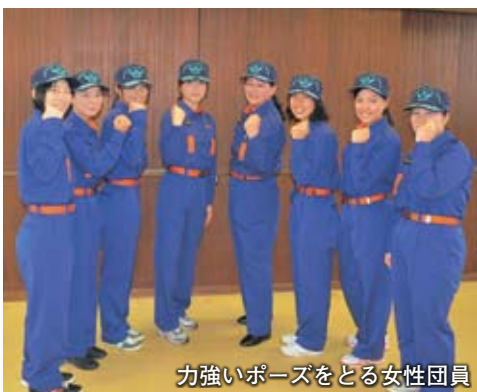
力強いポーズをとる女性団員