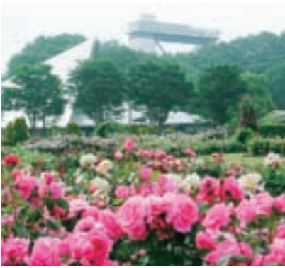
世界有数の品種数を誇るバラ園

初詣や初日の出など、大晦日から元旦にかけての恒例行事で、全国各地が賑わっています。イベン