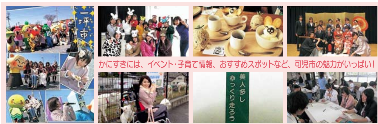
かにすきには、イベント・子育て情報、おすすめスポットなど、可児市の魅力がいっぱい！