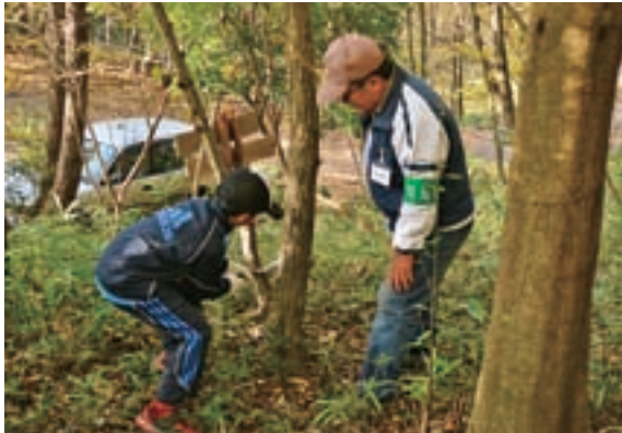
枝払いを体験する参加者