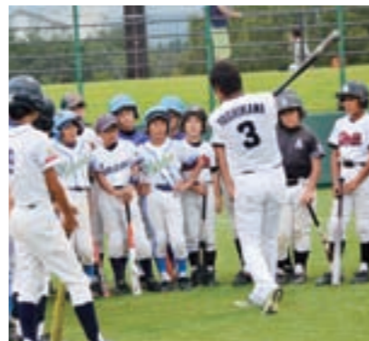
昨年開催された公式戦後の野球教室