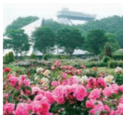
世界有数の品種数を誇るバラ園