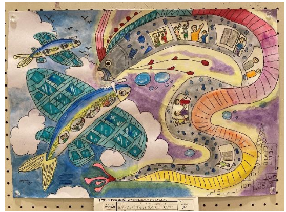
第43回 可児・御嵩 発明くふう展 絵画金賞 「太陽エネルギーで動く未来の魚型の乗りもの」