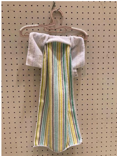
第43回 可児・御嵩 発明くふう展 作品銀賞 「落ちないタオル」