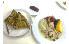
中華ちまき・蒸し物・栗蒸し羊羹