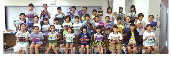
浴衣にぴったりかご作り 7/25