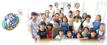
ヴェネチアンアクセサリ作り 8/19