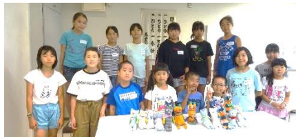
ソックアニマル作り 8/3