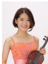
千田絵里奈 (ちだえりな) ヴァイオリン