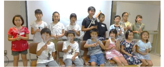
関電 光のブーケ作り 8/2