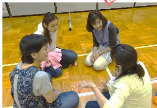
5/14 乳幼児学級 開講式とサポーターさんを交えたアイスブレイキング