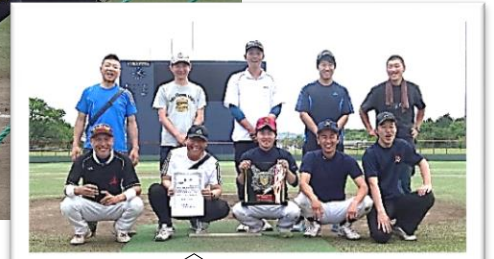
準優勝！坂戸のみなさん

5月19日(日)春里地区ソフトボール大会を開催しました。さわやかな青空の下、KYBスタジアムでは熱戦が繰り広げられ、優勝を決めたのは、3連覇 清水ヶ丘チームでした。皆さん大変お疲れさまでした。