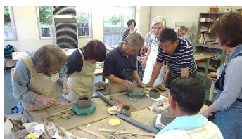
5/16 陶芸教室開講しました