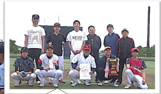
優勝！清水ヶ丘のみなさん