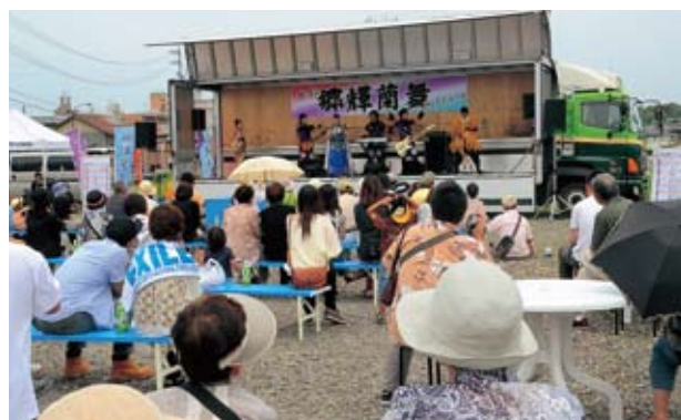
賑わい創出イベント（駅前において）

集客があれば、駅を利用する方な ども含めた食事の場もできるでしょ う。地域の皆さんによる青空市場や 趣味の露天商、賑わいを盛り上げる イベントも楽しいです。