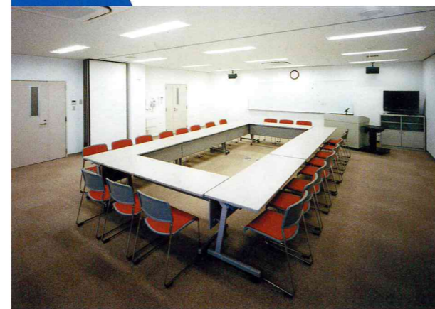
会議室は2分割することができ、大小様々な会議等に使用できます。