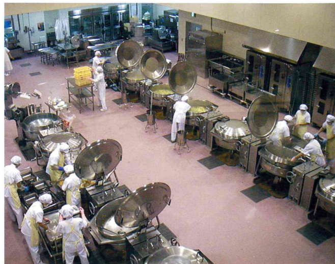
見学者通路から見た調理の様子