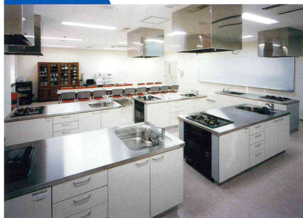
調理の実習をしたり、物資の選定などに使います。