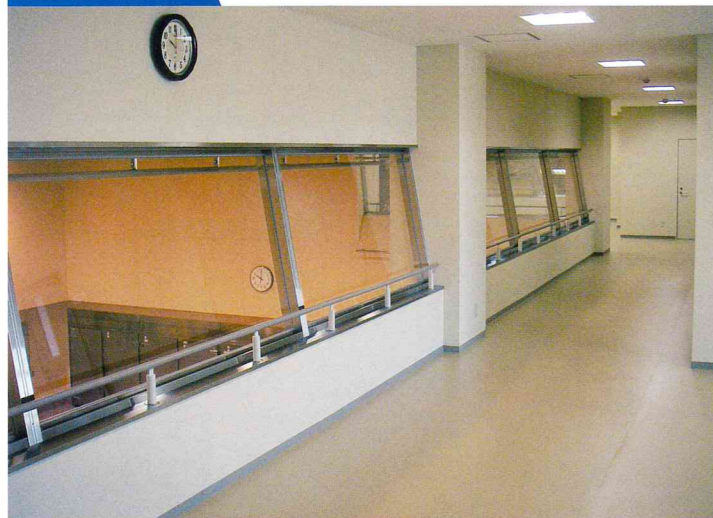
給食の調理作業や食器の洗浄作業を見学することができます。