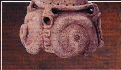
有孔罍付土器 上岩野遺跡出土土器 (財)岐阜県教育文化財団 文化財保護センター