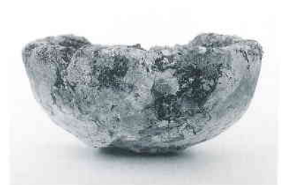
トリベ(鷺山仙道遺跡)