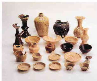
下石西山古窯出土品