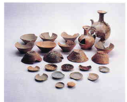
下石西山2号古窯出土品