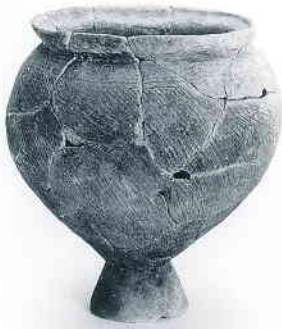
受口状口縁台付甕