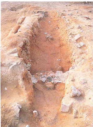
下石西山古窯(東から)