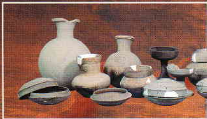
羽崎寺洞2号墳出土須恵器