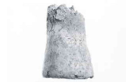
ふいごの羽口(鷺山仙道遺跡)