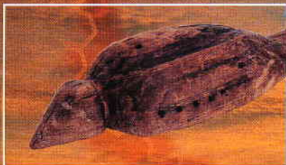
鳥形木製品 本川遺跡出土品 (財)愛知県教育サービスセンター 愛知県埋蔵文化財センター

平成16年度の可児郷土歴史館特別展として、「東海の発掘ニユース」を開催する運びとなりました。