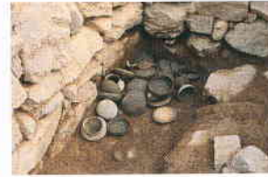
5号墳玄室内の遺物出土状況