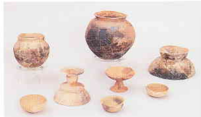
2067号住居跡出土土器