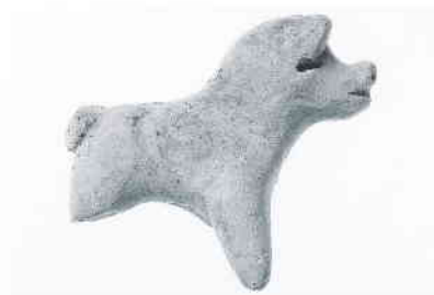
犬形土製品(鷺山仙道遺跡)

鷺山遺跡群の中に位置する遺跡。土地区画事業に伴い、平成11年度より進められている発掘調査の一環として、平成14年より調査を行っている。遺跡群内の他の遺跡同様、発見された遺構は主に戦国時代と古墳時代の2つの時代に分けられる。古墳時代の遺構からは、製塩関係の遺物・遺構が発見されている。また戦国時代の遺構からは大量の土師器皿(かわらけ)が発見され、墨書土器なども含まれていた。その他に陶製狛犬や漆器碗などが出土した。