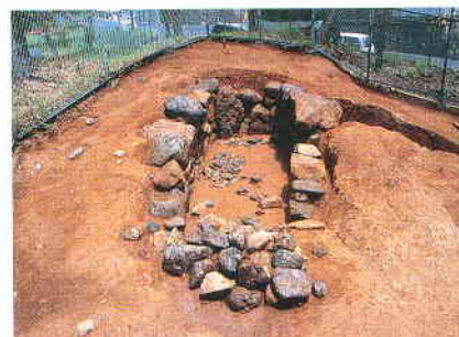
寺洞2号墳(石室前面から)