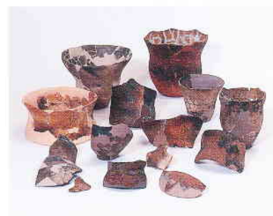
出土土器(縄文後期)

下水処理施設の建設に伴って行われた試掘調査により、平成6年に遺跡の存在が確認された。平成8年より4回にわたり調査が行われ、縄文後期から江戸時代までの遺構や遺物が検出された。縄文時代の遺構として竪穴住居、土器埋設遺構、石器製作関連遺構等を検出。弥生後期～古墳前期では5基の大型墳丘墓を中心とした遺構が展開する。古墳時代後期の円墳4基も確認された。