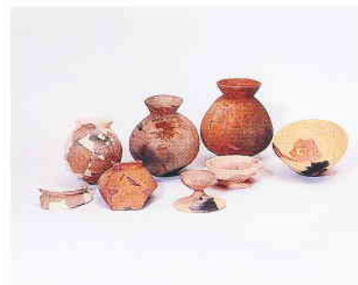
2号墳丘墓出土土器(弥生後期～古墳前期)