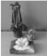
結び方や包み方によりさまざまな活用ができる風呂敷