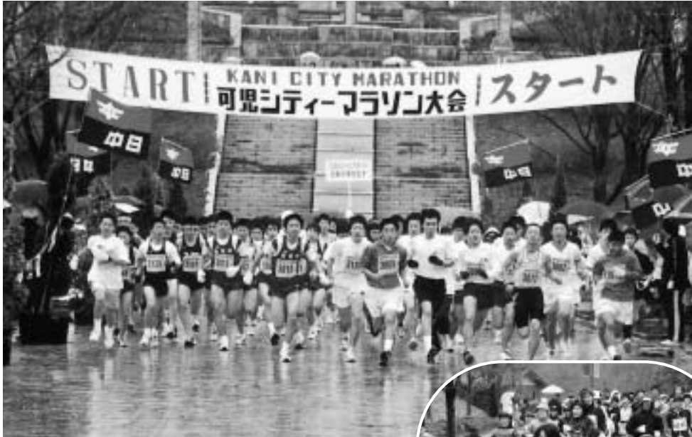
一勢にスタートする7部の選手たち(上・右とも昨年) 雨にも負けず、たくさんの方がジョギングに参加▶