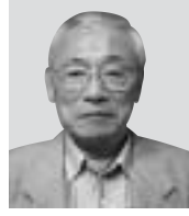
瑞宝双光章 ＜運輸行政事務功労＞

昭和30年から県林業試験場で試験研究を、昭和48年からは県林政部長など、37年間にわたり林政に携わられました。「仕事はひとりではできないこと。皆さんの代表としていただいたものと思います」と話されました。