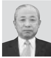
瑞宝双光章 ＜地方自治功労＞

昭和29年から46年間にわたり、小学校教諭、県の指導主事・教育事務所長、公立小学校長などを歴任。「子どもに言葉の力を付けるため、凡事徹底の一念で、地道な指導と研究の毎日でした」と笑顔で振り返られました。