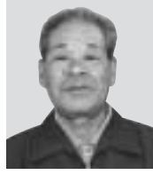
瑞宝単光章 ＜地方自治功労＞

昭和31年に運輸省に入り、昭和62年まで運輸行政に携わられました。三重県陸運事務所長、中部運輸局岐阜陸運支局長などを歴任。「一生懸命に務めたことが認められて、誇りに思います」と喜びを語られました。