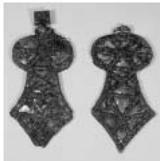
馬の装飾品 大須二子山古墳出土(愛知県)