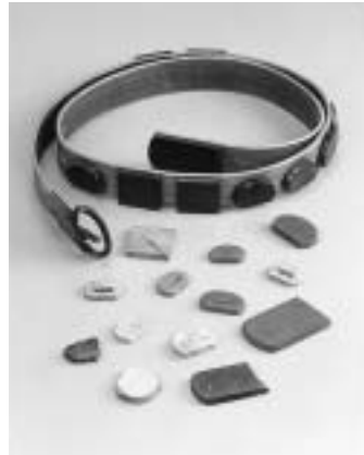
古代のベルト 斎宮跡出土(三重県)