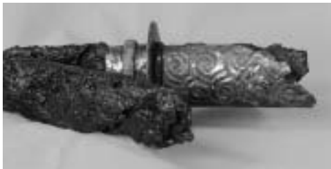
古墳時代の刀 熊野古墳出土(広見)

開催期間 10月18日(土)～11月30日(日) 場所 可児郷土歴史館(久々利)