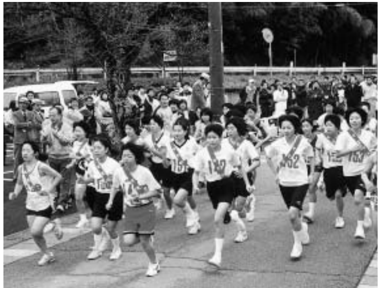
可児郷土歴史館をスタートする第5~7部の女子選手たち(昨年の様子)

市体育連盟は、今年で第46回を迎える冬の恒例行事、可児駅伝競走大会の出場チームを募集します。 御嵩町から可児市までの6区間。友達、職場の同僚、地域の仲間たちと一緒に、初冬の可児路を走り、たすきをつないでみませんか。 期日 12月14日(日) 雨天決行 出発時間 午前9時30分(両コースとも)