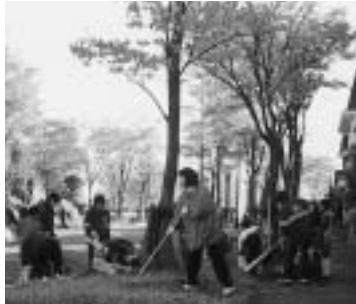
道路の清掃をする皆さん( 翠ヶ丘・昨年 )

市民参加のまちづくりを推進する花いっぱい運動が、この秋も実施されます。みんなで参加しましょう。