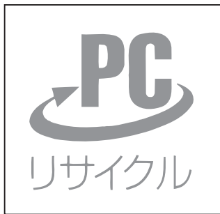
PCリサイクルマーク

平成15年10月1日以降に販売される家庭系パソコンには、PCリサイクルマークが付いています。マークが付いているパソコンを処理する場合は、メーカーに引き取り義務がありますので、メーカーに連絡をして、適正にリサイクルしてください。