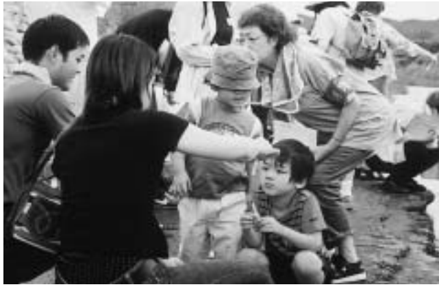
川の水質を調査する参加者たち

七月二十一日海の日に、市内の河川の水質を調べ、そこにすむ生物を観察する「カワゲラウオッチング&可児市一斉水質調査」が行われました。その結果をお知らせします。