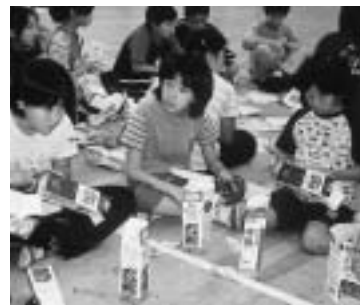
牛乳パックでびっくり箱を作る参加者

ムを楽しみながら、異なった地区や年齢の子どもたちと仲間づくりをする交流会「わいわい可児っ子大集合2003」の参加者を募集します。