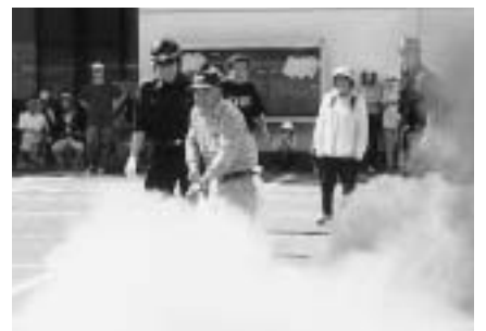
昨年の防災訓練の様子（久々利公民館）