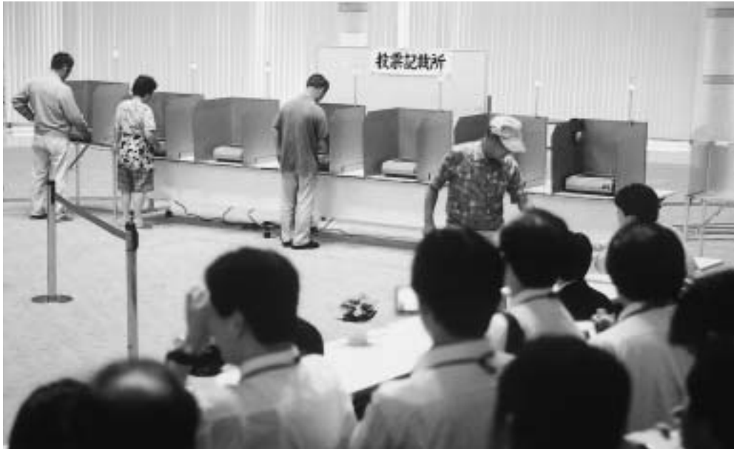
全国から大勢の視察者が訪れた広見第二投票所の投票風景