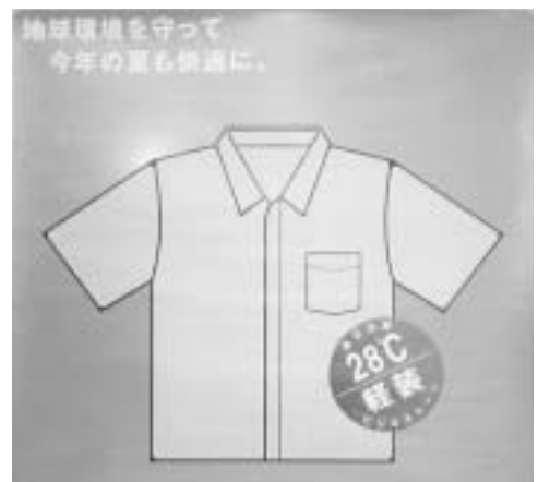
サマーエコスタイルキャンペーンは9月23日まで