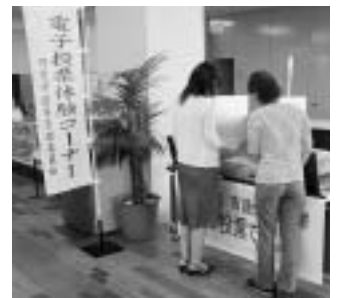
体験コーナーの様子(市役所)

7月20日(日)は、電子投票機による可児市議会議員選挙の投票日です。皆さんそろって投票にお出掛けください。 問合先 可児市選挙管理委員会事務局(総務課内)