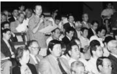
自治会長から市政について提言や要望が出されました

A 現在、市内で二十二の自主防災組織が結成されています。また二十九の自衛消防隊も存在しますが、これは従来からの地域に設置されているものです。自主防災組織は団地でも結成していただけるもので、立ち上げの奨励費や活動費を助成し、結成の奨励を今後も進めます。