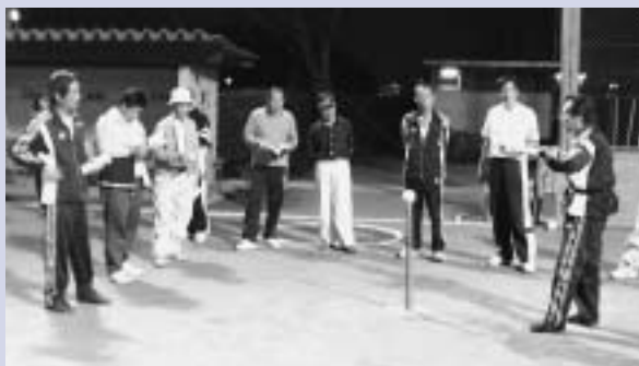
テーパーボールのデモンストレーションの様子（5月18日）

広見体育振興会は主な活動として、春の地区対抗ソフトボール大会、秋のスポーツフェスタ、地区対抗ソフトバレーボール大会、軽スポーツの普及指導を行っています。また、各地区行事や公民館祭りに参加したり、各種スポーツ団体の育成に協力したりして、地区の皆さんの体力向上を目指し、共に活動しています。