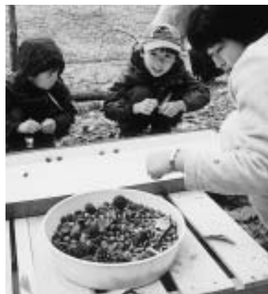
木の実を使って遊ぶ参加者(昨年)