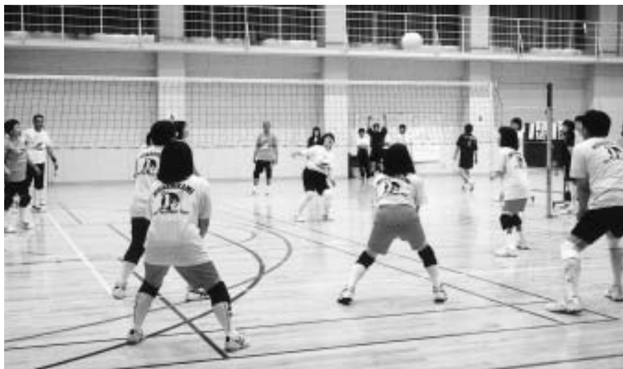
体育指導委員が広めた6人制ソフトバレーボールの大会（5月25日）