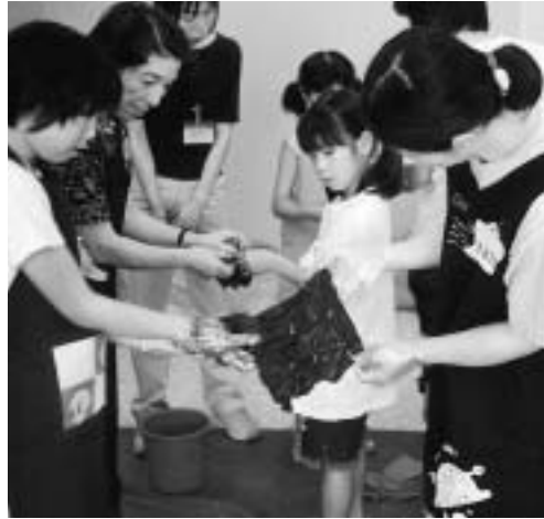
あい染めを体験する参加者(昨年)