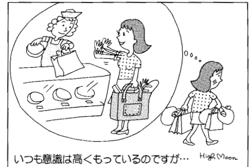
いつも意識は高くもっているのですが... High Moon

経済産業省(旧通産省)のアンケート調査によると、一般市民の環境問題に対する関心度はとても高く、9割以上の方が「消費者一人ひとりが対応すべき」または「できることがあれば協力したい」と答えています。しかし、例えば買い物袋持参という行動を実際に行っている人は、わずか1割程度にとどまっています。