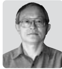
勲五等瑞宝章 ＜保健衛生功労＞

専門は人類学。この45年間、人類の発生と進化の研究に携わり、一貫して「人間とは何か」を追及してこられました。「環境問題への対応方法などは、人間の進化と深く関わる事柄です。今までの研究の成果を講座や講演を通して皆さんに伝え、社会に恩返しをしていきたいですね」と穏やかに話されました。