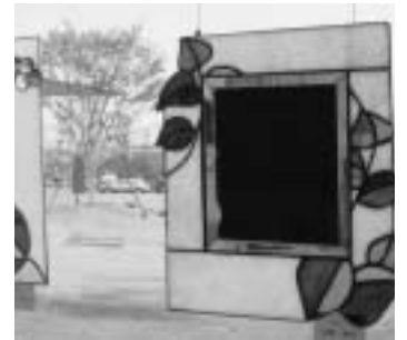
ステンドグラスを使った鏡