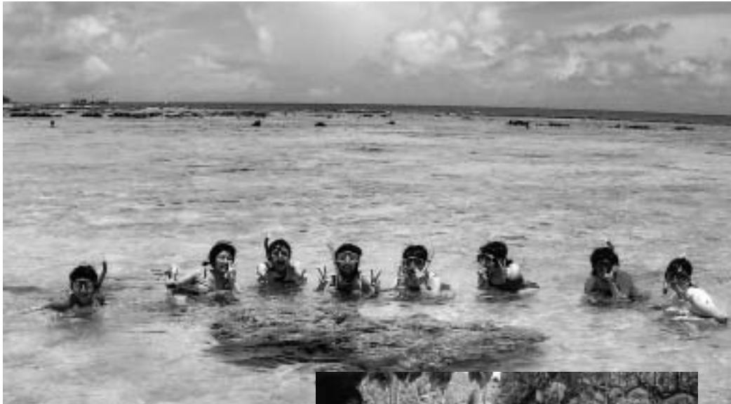
澄んだビーチでシュノーケリング体験(写真はすべて昨年の様子)