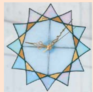
ステンドグラスの時計