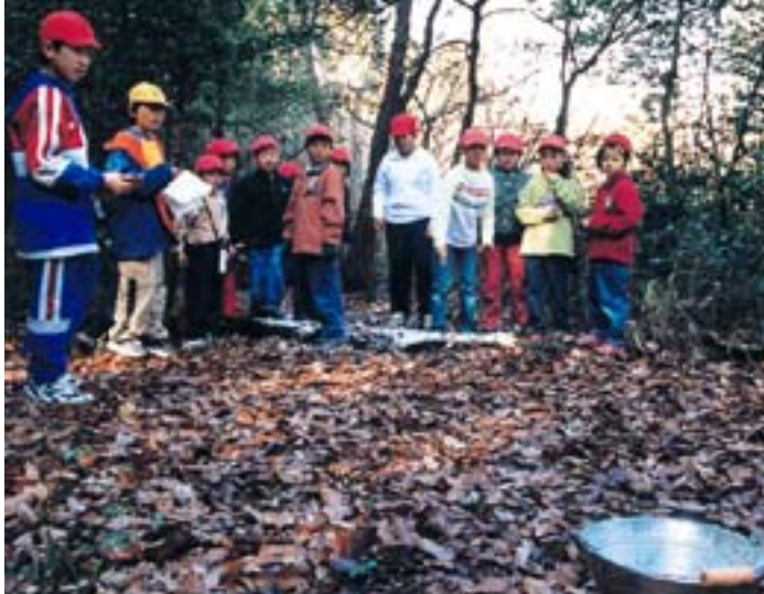
えがおの森で「まつぼっくり投げ」を楽しむ児童たち