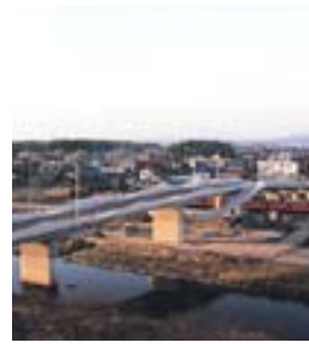
建設中の橋の様子

市は、今年3月に開通する予定の、都市計画道路中恵土広見線にある、可児川に架かる橋の名称を募集します。