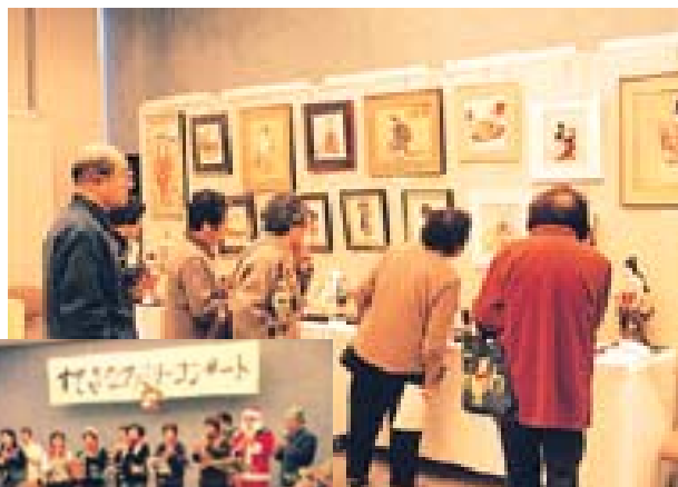
数々の作品に見入る来場者たち

また、12月8日には「すてきなファミリーコンサート」が開かれ、五つのグループが日ごろの練習の成果を発表。ケーナやコカリナなど珍しい楽器の演奏もあり、訪れた人は手づくりのコンサートに聴き入っていました。