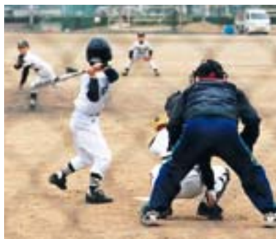
各地域で活発に行われているスポーツ少年団の活動

動に参加したり、地区の運動会や公民館祭りの運営に加わったりと、各地域の行事や活動に参加することで、子どもは自分も地域の一員であることを自覚することができます。