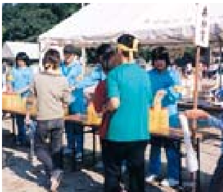
地区運動会で運営に参加する中学生

高くなるとIQも高くなるという話がある。人とかかわり体験することは、思いやりにつながるので、ゆりの教育は大事（中三保護者） いろんな人と交わり経験することが心の栄養になり、学力にもつながっていくことで判断力もつく。休みにいろんな体験ができる場所が地域に増えるといい（小四保護者） 以上のように、皆さんそれぞれ家族で過ごしたり行事に参加したりするなどで、土曜日の過ごし方を考えているようです。