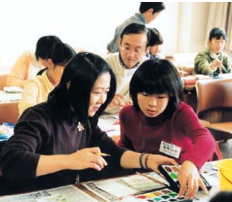
土曜日に公民館で開催されている講座で絵手紙作りを楽しむ親子(帷子公民館)

IQ(知能指数)が高くなってもEQ(思いやり、その他の情動を加味した知能)は高くない。EQが