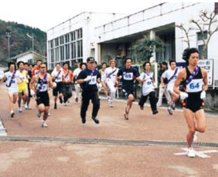
可児郷土歴史館から勢いよくスタートする選手たち