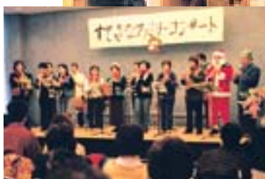
美しい音色を響かせたケーナの発表