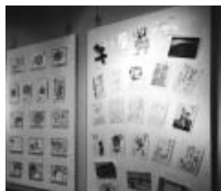
さまざまな趣向を凝らした年賀状(昨年)

申込方法 作品の表面に住所、氏名を明記して図書館本館に直接提出するか、または郵送