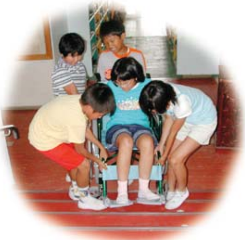
工夫を凝らした総合的な学習（旭小）

これからの社会は、生涯を通じて、 いつでも主体的に学び続けるとい う生涯学習の考え方が重要になります。教 育は学校教育のみで完結するものでは ありません。このため学校では、新し い学習指導要領やエデュース・ナイン のもとに、新しく設けられた総合的な 学習の時間（各学校が創意工夫をして、 これまでの教科の枠を超えた学習など ができる時間）などを利用し、各教科 の学習で得た知識を、さまざまな体験