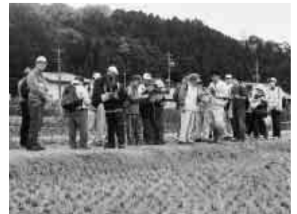
説明を聞く参加者（昨年）

期日 17年2月26日（土）、27日（日）の環境フェスタ期間中 場所 広見公民館ゆとりピア 応募作品は返却しません。 ふるさと発見ハイキング 期日 12月5日（日）雨天決行 時間 午前9時～午後3時 集合場所 市役所（現地までバスで送迎します） コース 今渡の渡し場跡～川