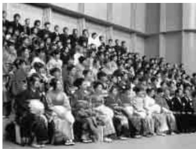
たくさんの成人が集う成人式(昨年)

市は、来年成人式を迎える皆さんへのメッセージ(はなむけのことば)と、新成人からのメッセージを募集します。送られたメッセージは、成人式に掲示します。