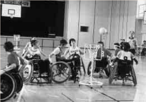
ゴール付近で競り合う選手(昨年)

今年は10周年記念大会として、2日間にわたり熱戦が繰り広げられます。ぜひ応援に来てください。