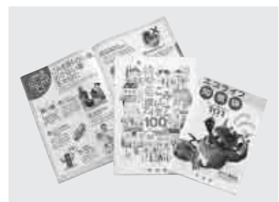
暮らしに役立つアイデア満載 問合せ 環境課

そんな具体的なアイデアを紹介した冊子「エコライフ知恵袋」と「ごみ減らしアイデア100選」を市環境課で配布しています。楽しみながら、一つ一つ実行してみましよう。