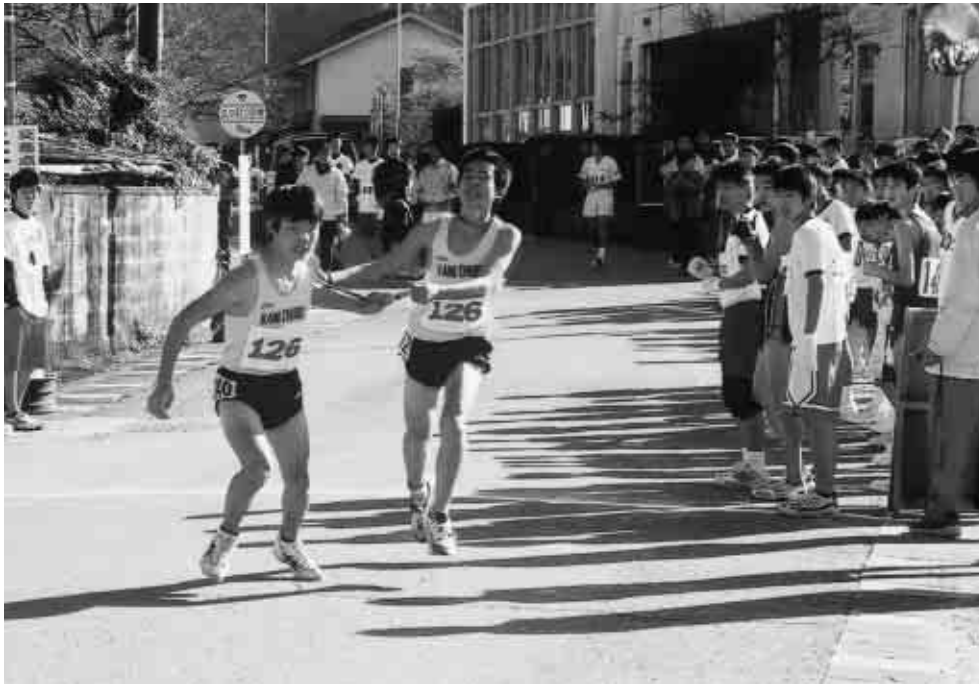
次の走者にたすきをつなぐ参加者たち（昨年）