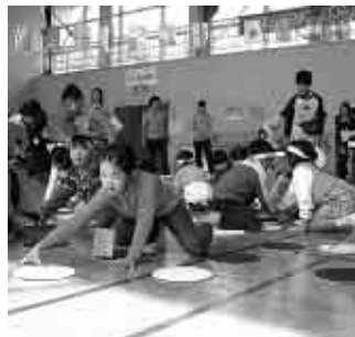
ジャンボオセロを楽しむ参加者(昨年)

児童センターは、子どもたちに日ごろできない遊びを体験してもらうため、移動児童館を開催します。