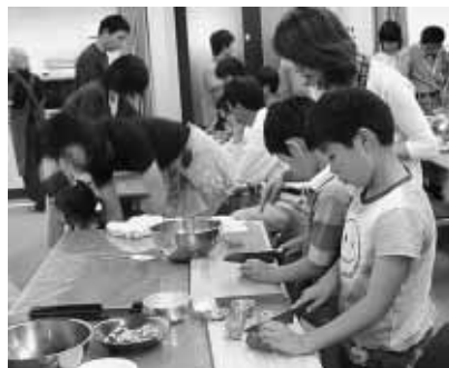
エコクッキングを楽しむ参加者