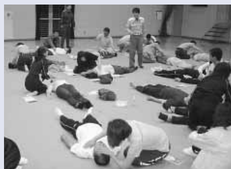
救命講習会の様子

下恵土体育振興会は、下恵土自治連合会・下恵土公民館と協力し、スポーツ行事の企画運営の中心的な役割を果たしています。