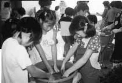
あゐ染めを体験する子どもたち（昨年）

市では、夏休みに親子体験教室の参加者を募集します。3つのコースでは、それぞれ体験を通して、楽しく環境について学ぶことができます。夏休みの思い出作りに体験してみませんか。