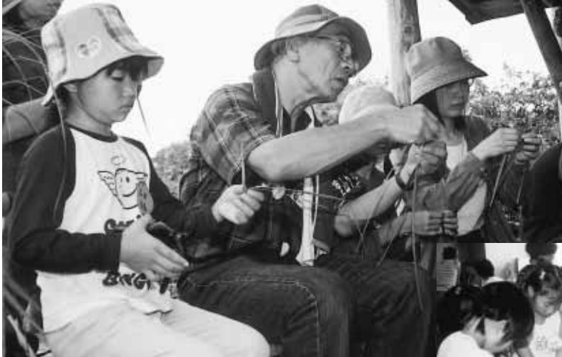
ススキの葉を使った工作（昨年）