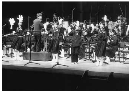
会場を盛り上げる出演者(昨年)

市文化芸術振興財団は、市内在住・在勤の音楽グループが日ごろの練習の成果を披露する「可児市民音楽祭」を開催します。皆さん、ぜひお出掛けください。