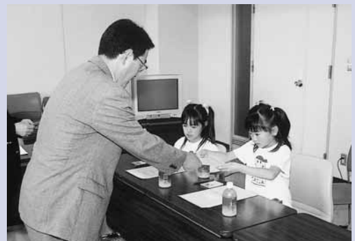
5月22日の結団式で、任命書を受け取る団員