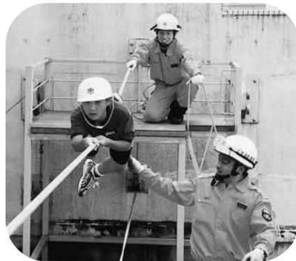
南消防署（下惠土）では綱渡りに挑戦