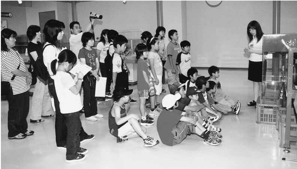
ささゆりクリーンパーク（塩河）でゴミ処理について学ぶ（写真はすべて昨年）