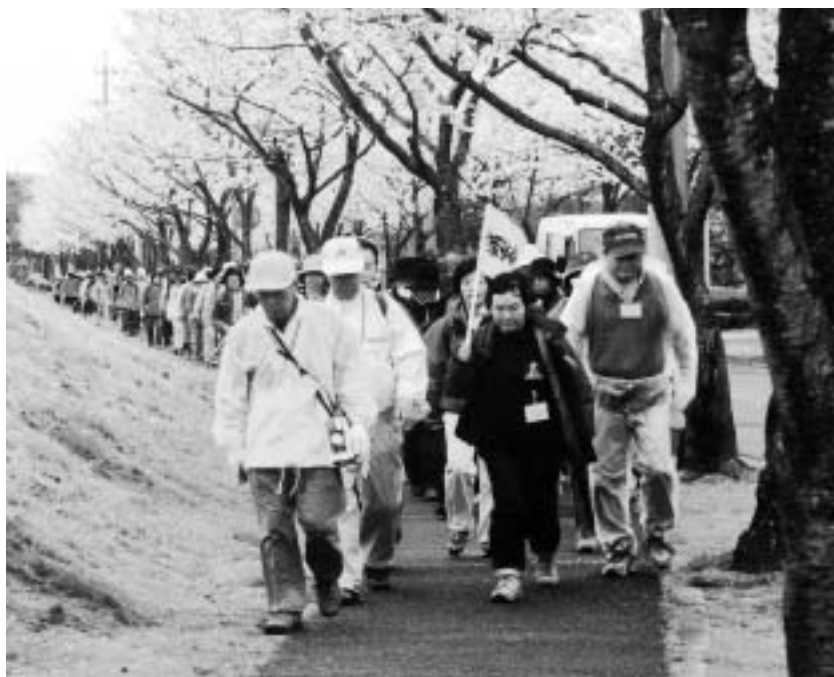
ゴールを目指して歩く参加者たち(昨年・桜ヶ丘)

回の運営に協力していただきます。健康の自己管理には、十分注意して申し込んでください。体調によつては、参加について相談