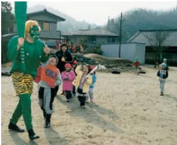
園の畑で作った豆を鬼にぶつける園児たち(久々利保育園)