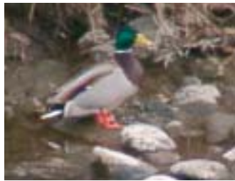
可児川にたたずむ雄のマガモ