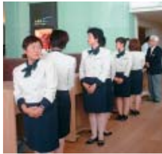
制服姿で活躍する皆さん