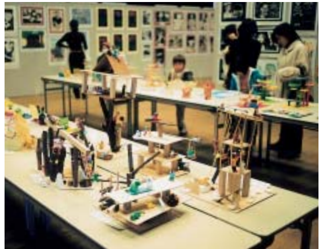
展示された作品とそれを見入る見学者

会場には、子どもから大人までたくさんの見学の人が訪れ、自分の作品を親に教えたり、友だちの作品を見たりしていました。