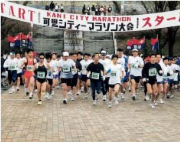
一斉にスタートする参加者たち