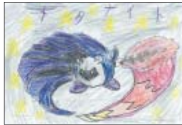
メタナイト (みずきケ丘)