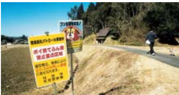
ポイ捨てとふん害の防止を呼び掛ける立て看板（久々利）

回答 当市におきまして平成十一年三月に「ポイ捨て及びふん害の防止に関する条例」を制定し、市民の快適な生活環境の確保に努めております。特に環境美化を推進する必要があると