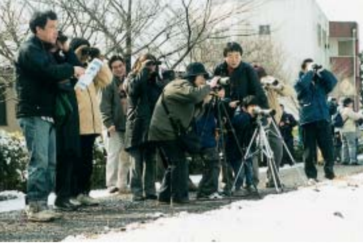
野鳥を観察する参加者たち