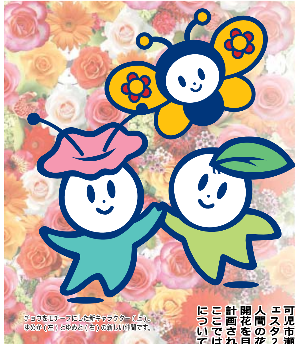
チョウをモチーフにした新キャラクター(上)。ゆめか(左)とゆめと(右)の新しい仲間です。

県民の皆さんによるプロジェクト。手作りの多彩な企画がめじろ押しです。 花の甲子園(コンテスト) 巨大寄せ植え 各種体験教室・講座 ほか多数計画されています。