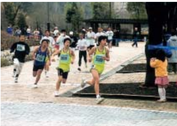
ゴールを目指し力走する参加者たち