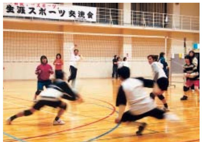
熱のこもったプレーを繰り広げる参加者たち（広見公民館ゆとりピア）

参加者たちは、熱のこもったプレーを繰り広げ、会場は掛け声と歓声でいっぱいでした。