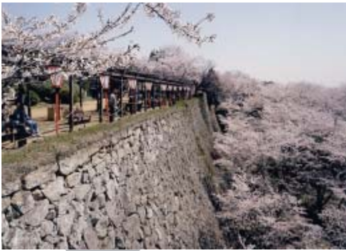
咲き誇る桜に彩られた津山城の石垣