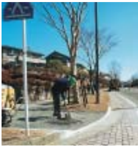
バリアフリー化を進める歩道改良工事（梶ヶ丘）