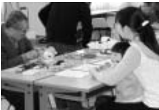
おもちゃを修理してもらう親子(昨年)