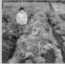
生ごみ等有機肥の野菜

期日 3月14日(日) 時間 午前10時~正午 場所 帷子公民館 定員 40人 受講料 無料 申込締切 3月12日(金) 申込・問合せ先 環境課