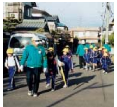
下校する児童を送り届ける帷子地区の地域安全指導員の皆さん

また、帷子地区の地域安全指導員は、小学一年生の児童を、学校の下駄箱まで迎えに行き、それぞれの団地まで送り届ける活動も行っています。