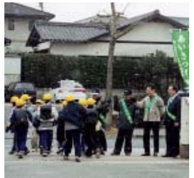
下校する児童にあいさつをする桜ヶ丘地区の青少年育成市民会議の皆さん

また、桜ヶ丘小学校区では、不審者の目撃や事件などが下校時に多く起きていることから、青少年育成市民会議の人たちが登校時と併せて下校時にも校門に立ち、子どもたちに声を掛け注意を促すとともに、下校時の安全を見守っています。