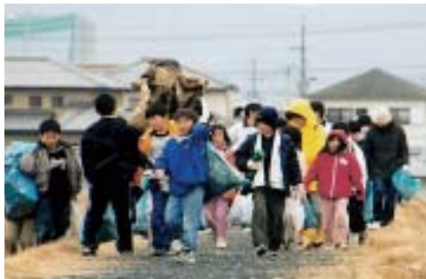
昨年行われた可児川の清掃(上)と市役所での分別作業