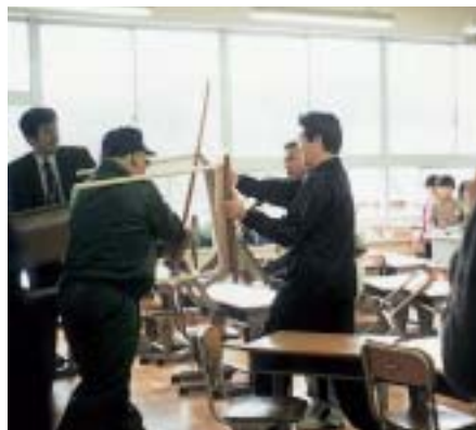
昨年、小学校で行われた防犯訓練（土田小）

学校では、子どもの学校生活での安全確保のため、実際に不審者の侵入などがあったときの体制や対応の整備、教師の危機管理能力の向上、日常における安全確保、事件や事故があったときの安全確保、通学路や校内の点検・整備、子どもへの安全に対する教育と危機意識の啓発などを行っています。可児市内の小中学校でも、次のよう