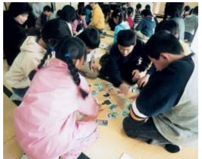
郷土かるたの絵札を取り合う小学生たち

この日参加したのは、地元の小学生約70人。同公民館で活動するどんぐり文庫のメンバーが歌を詠み上げると、グループに分かれた子どもたちが一斉に絵札を取り合い、昔ながらの遊びを楽しんでいました。