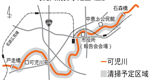
可児川清掃予定区域図

集合時間と場所 午前8時30分までに市役所、中恵土公民館、可児川苑(坂戸)のいずれかに集合(申し込み受け付け後に、集合場所と清掃範囲をお知らせします) 内容 グループに分かれて清掃活動を行い、拾ったごみを種類ごとに集計。終了後、市役所に集合して報告会などを行う(清掃活動のみの参加も可能です) 持ち物 汚れてもいい服装と