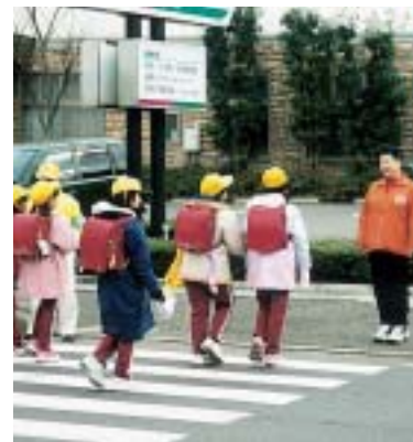
交差点で立哨を行う民生児童委員ら