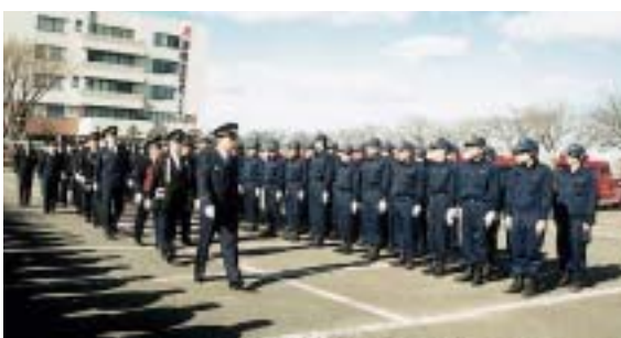
二列横隊に整列した団員を市長らが観閲

から、色とりどりの見事な一斉放水が行われました。強い北風に舞い上げられたしぶきが駐車場全体を包み込み、奇麗な虹も見ることができました。