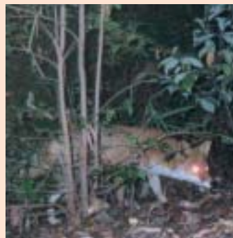
(平成15年11月)