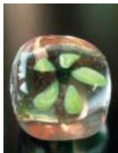
花模様入りのペーパーウエート

期日 3月7日(日)または3月8日(月)のいずれか 時間 午前10時～正午 場所 わくわく体験館(塩河) 内容 溶けたガラスでペーパーウエートを2個作る 対象者 小学4年生以上(大人も可) 参加費 1500円 定員 各12人(抽選) 申込締切 2月20日(金) 申込・問合先 同館 ☎ 1515