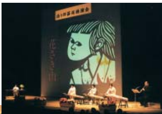
邦楽蘇水の皆さん による語り聞かせ のステージ（上） と会場の生徒たち