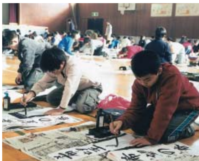
課題「希望の春」を書き上げる5年生（広見小学校）

授業などで練習する機会があるとはいえ、慣れない毛筆に慎重な筆運びで取り組む子、一気に書き上げる子など、思い思いに新年の気持ちを筆に込めていました。