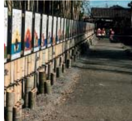
きれいに整備された通学路（下恵土）

竹やぶが荒れて道路に覆いかぶさり、不審者も現れる暗い通学路になっていました。そこで下恵土のボランティアグループ「宮美会」は、所有者の協力を得て、竹を手入れして歩道を整備し、百人一首の札のパネルを百枚掛けしました。これにより、楽しみながら歩けることができる、明るい通学路に生まれ変わりました。