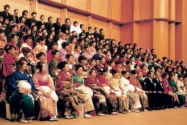
卒業中学校ごとに ステージに並んで 記念撮影