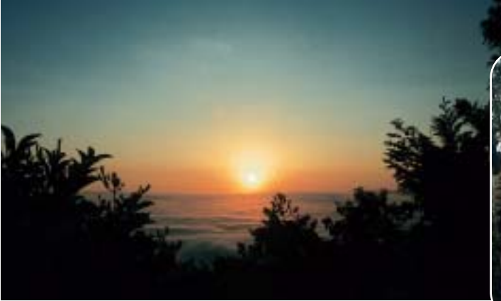
鳩吹山から見た日の出 (上と参加者(右上)、 浅間山から見た日の出 (右と参加者