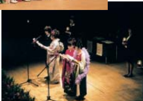
「誓いのことば」を述べる企画運営委員の皆さん