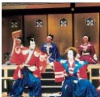
昨年の可児歌舞伎祭での舞台

「第11回飛騨・美濃歌舞伎大会かに」実行委員会、岐阜県地歌舞伎保存振興協議会などは、「第11回飛騨・美濃歌舞伎大会かに」を開催します。