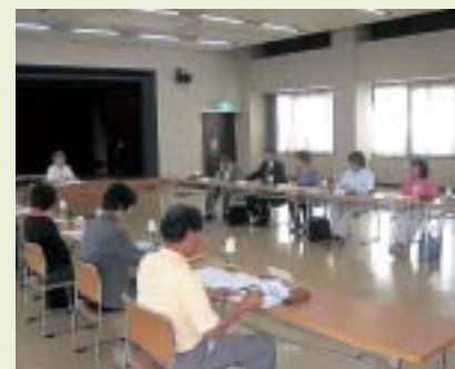
熱心に議論する策定委員の皆さん