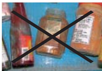
ピンは洗って出しましょう

リサイクルステーションに、ビンの中身が入ったまま出したり、洗浄しないで出していることがあります。中身が残っているビンや、洗浄されていないビンはリサイクル資源にはなりません。 ピンはふたやキャップを取り、中を洗って、種類ごとに分けて出しましょう。