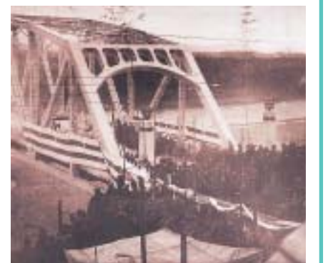
太田橋の渡橋式(可児町史より)

中山道の渡河点であった「太田の渡し」は「木曾のかけ橋」(長野県)、「碓氷峠」(群馬・長野県境)と並び中山道の三大難所と言われていました。木曾川に橋が架かる前、船での渡河は水位の影響を受けるなど、あまり便がよくありませんでした。