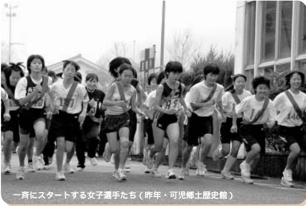
一斉にスタートする女子選手たち (昨年・可児郷土歴史館)