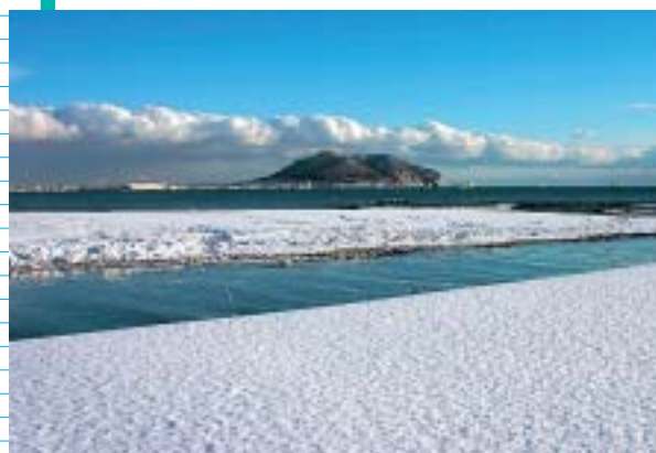
木地挽高原から函館山を望む