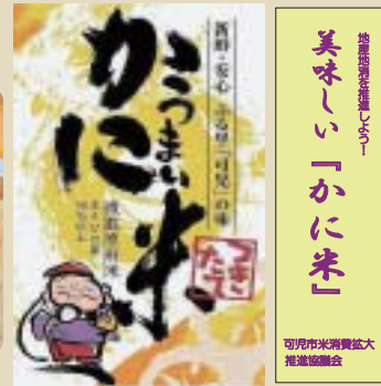
取扱い店はこのほり旗が目印です