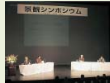
●問合せ先 都市計画課

今回の景観シンポジウムが、今後の景観まちづくりに生かされることを期待しています。