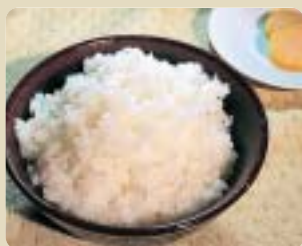
お米を食べて毎日元気！

今年も、可児市米消費拡大推進協議会（めぐみの農協・市内米穀店・可児市による）は、可児で作られたお米を、多くの皆さんに食べていただくために、「かに米」キャンペーンを実施しています。可児地域で一番多く作付されているお米「あさひの夢」は、「ハツシモ」の血筋を引き、粒ぞろいが良く、舌ざわりの滑らかな食味のお米です。キャンペーンでは、この「あさひの夢」を「かに米」として、市内の農協や協議会加盟の米穀店店頭でお値打ちに販売しています。