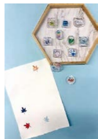
ぷっくり立体シール