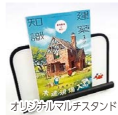
オリジナルマルチスタンド