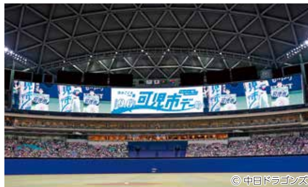
令和7年9月6日 巨人戦で実施された「岐阜県可児市／住みごこち一番 可児市デー」で大型ビジョンに映る参加者

さらに、希望者は始球式の投球、選手への記念品贈呈、オンユアマークスに参加の応募ができる！