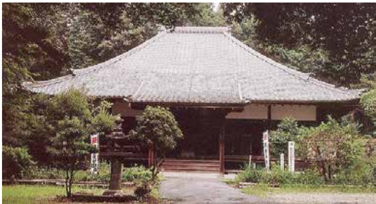
薬王寺本堂(帷子地区)