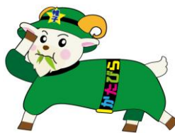
帷子地区センターイメージキャラクター 「くさなックス」