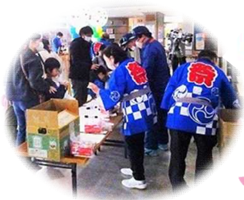
受付で参加賞を受取りゲームに参加