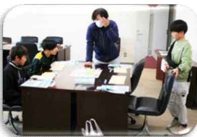
医療の未来は任せたよ！