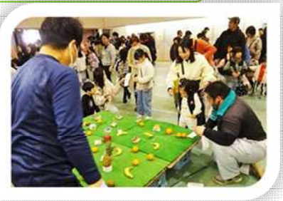
輪投げでゲットしたよ