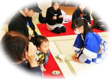
抹茶で一服、どうぞ