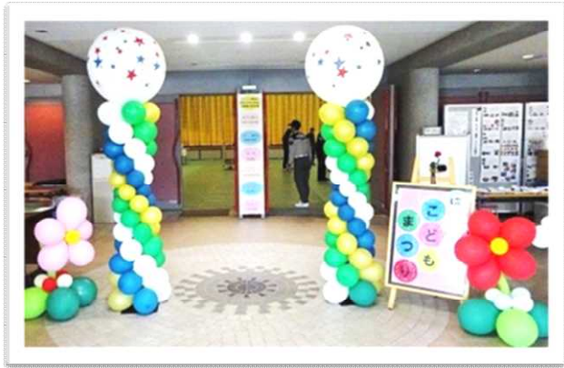
ウエルカム ゲートでお迎え