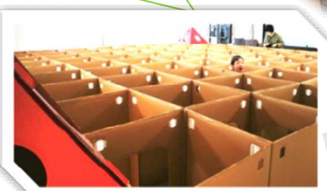
リサイクルで工作