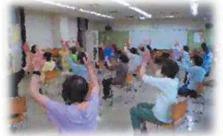
【昨年度健康体操の様子】