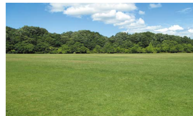
トイファクトリーの丘(ふれあいパーク・緑の丘)

民間企業のアイデアやノウハウを活用しながら、東海地区に誇る魅力ある公園として再整備を進めます。