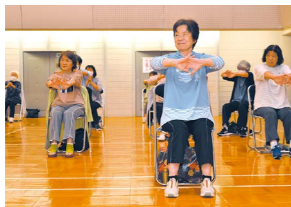
まちかど運動教室の様子

LINEで参加履歴の記録や開催情報の受け取りができるようになります。より気軽に参加できるようになります。