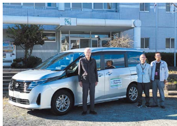
若葉台高齢福祉連合会へ貸与した車両

車を無償で貸し出し、高齢者の移動手段の確保をサポートします。新たに1台ずつ清水ヶ丘地区と桜ヶ丘地区の団体へ貸し出します。