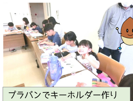
プラバンでキーホルダー作り