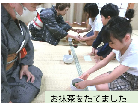
お抹茶をたてました