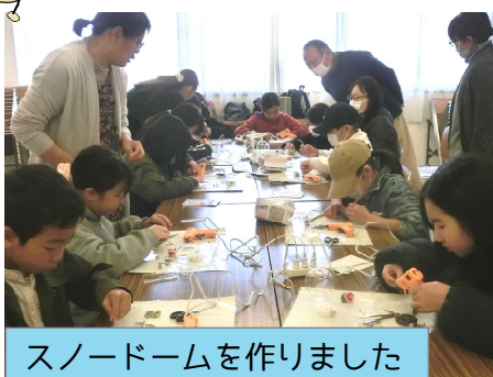
スノードームを作りました