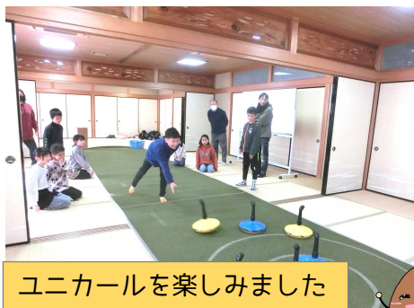
ユニカールを楽しみました