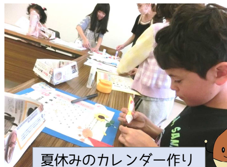
夏休みのカレンダー作り