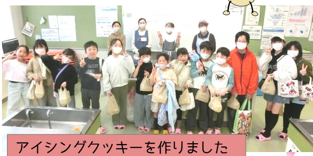
アイシングクッキーを作りました

ちいき しどういん やさ 地域の指導員さんが優 しく教えてくれます。 あんしん さんか 安心して参加してね！