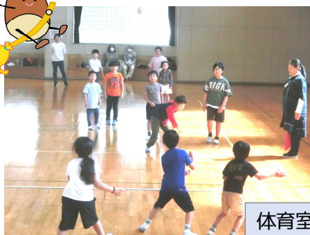
体育室でいろんな遊びをしました♪

こんでくださいね。した しやしん れいわ ねんど ど ようす 込んでくださいね。下の写真は令和7年度の「土ようひろば」の様子です。