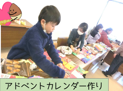
アドベントカレンダー作り