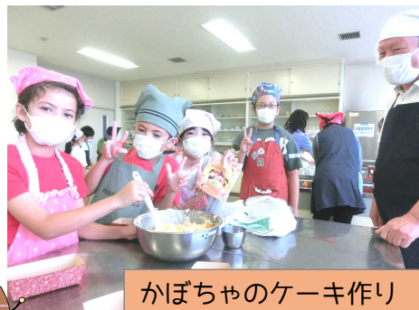
かぼちゃのケーキ作り