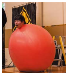
マジシャンつつきー