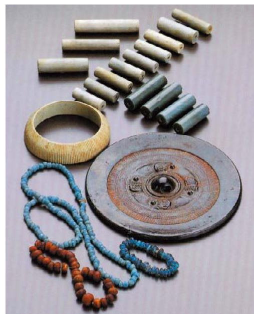
長塚古墳から出土した銅鏡や管玉など

古墳の大きさや見つかった品物から考えて、長塚古墳は、可児を含む東美濃一帯を支配していたリーダーのお墓と考えられます。