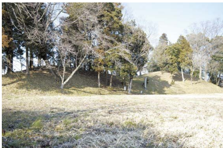
長塚古墳(中恵土地区)