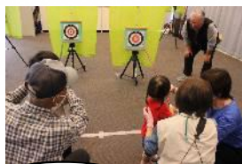
健康フェア可児に UNICダンスとチア 148人が出演♪ 吹矢体験も大人気！

ケーブルテレビ可児 DANCE!DANCE!LIVE ♪ in 可児中日ハウジングセンター