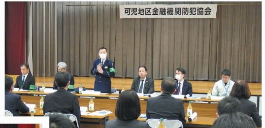
金融機関防犯協会総会 (中恵土地区センター) (R7. 11. 13)