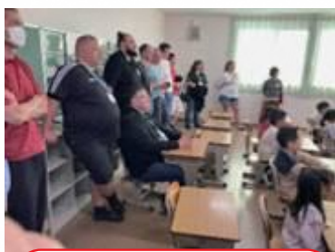
今渡北小学校の国際教室の参観