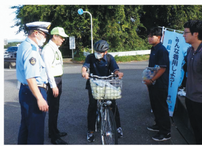
MSリーダーズ活動 (ヘルメット着用・自転車2ロック) (R7. 9. 22)