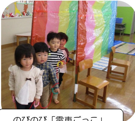
のびのび「電車ごっこ」