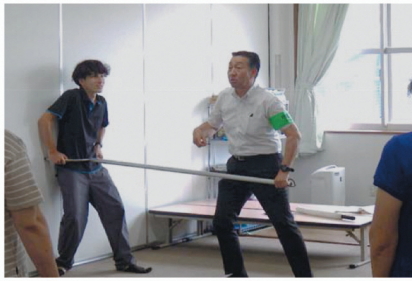
キッズクラブ不審者対応訓練 (桜ヶ丘小学校) (R7. 9. 5)