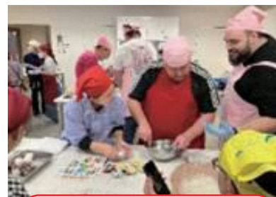
郷土料理体験では里芋茶碗蒸し、鶏ちゃん、 花のかざり巻さずしが大好評！！

一昨年に事務局長がドイツのニュルンベルク市のスポーツクラブや関係機関の視察に参加しました。その後、昨年の11月にドイツニュルンベルクユーゲン（スポーツ少年活動）から岐阜県の総合型地域スポーツクラブの視察に行きたいという要望があり、20代～50代の役員9名が来日されました。可児市の小中学校や体育施設、郷土料理などを見学・体験していただき交流を深めました。ドイツは総合型地域スポーツクラブの発祥の地であり、市民スポーツの普及や育成などの課題を情報交流し、とても有意義な時間を共有することができました。ご協力いただきました多くの皆様に感謝し、今後の発展につながることを願います（＾＾）／