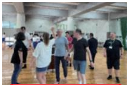
蘇南中学校で生徒と一緒にダンス♪