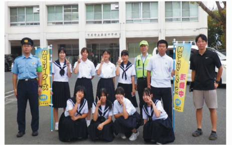
MSJリーダーズ活動・自転車2ロック (蘇南中学校) (R7. 10. 7)