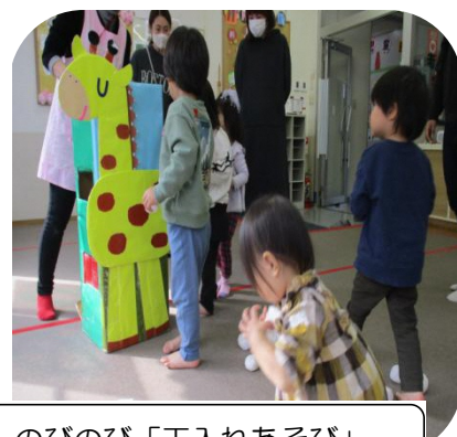
のびのび「玉入れあそび」