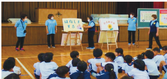
連れ去り防止訓練(ひまわり班・土田小学校) (R7. 10. 17)