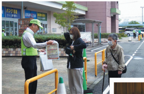
年金啓発活動 (ラスパ御嵩店) (R7. 10. 15)