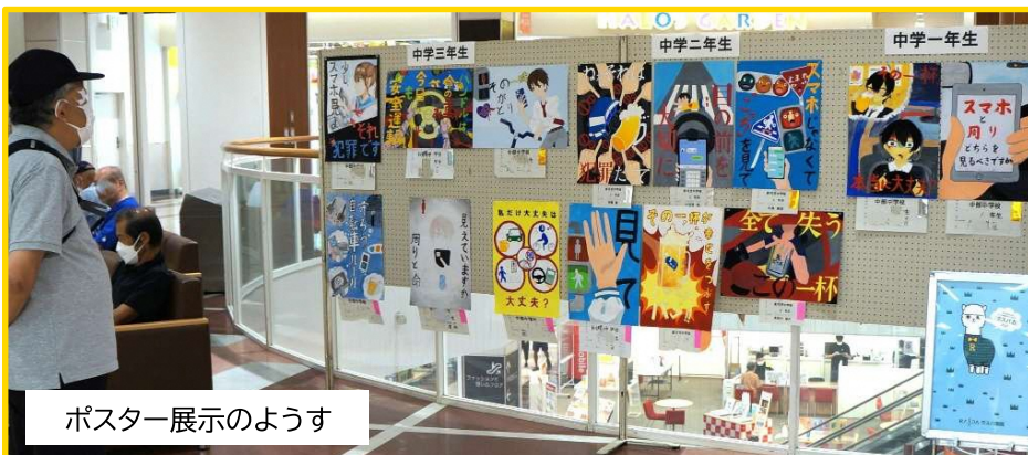
ポスター展示のようす