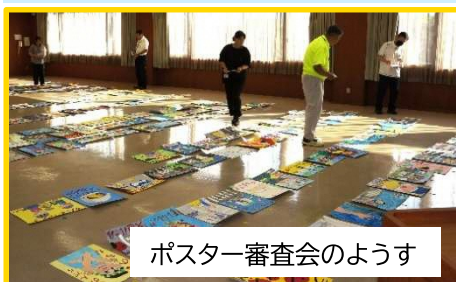
ポスター審査会のようす

9月17日～10月20日まで、ラスパ御高店内、可児市役所ロビーにて、厳正な審査の上入賞した『交通安全ポスター』を展示しました。