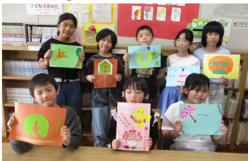
あそびの教室 「切り絵いろいろがみ」