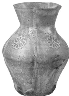
志野花入 昭和28年 多治見市教育委員会蔵

今年は豊蔵生誕130周年を迎えます。その記念として本展では、彼独自の表現を展開した志野と瀬戸黒の秀逸作品を年代ごとに展示します。美濃桃山陶の魅力を取り込みつつ、その枠から脱却しようとする挑戦的な姿を、作品を通して紹介します。また、豊蔵を支えた家族との絆を紹介するとともに、可見市で展開する美濃焼の現在を、可見陶芸協会の作品を通じて紹介します。