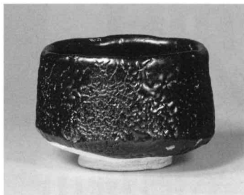
瀬戸黒茶碗 銘清澄 昭和52年 清荒神清澄寺蔵