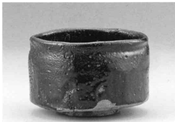
瀬戸黒茶碗 昭和 当館蔵