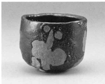
瀬戸黒梅絵茶碗 前田青郵絵 昭和37年 当館蔵

活気に満ちた織豊期に出現し、江戸時代前期までのわずかに数十年に作られた茶陶、黄瀬戸・瀬戸黒・志野・織部。姿を消して400年後の志野の陶片発見まで、産地が不明であったやきものです。志野陶片の発見者・荒川豊蔵は、志野釉の美しさに魅かれ、その再現に挑みます。美濃桃山陶4種のやきものの中でも特に、志野、瀬戸黒、黄瀬戸を中心に制作し、志野と瀬戸黒で国の重要無形文化財保持者に認定されました。産地ではなく個々のやきものの認定はその技法の特殊性が反映されたものであり、豊蔵の体得した技を高く評価した証です。豊蔵の美濃桃山陶の再興は、美濃焼界に新たな風を吹き込みました。