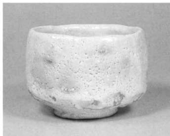
志野茶碗 銘随縁 昭和52年 清荒神清澄寺蔵