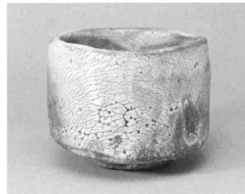
志野茶碗 銘不動 昭和28年 国立工芸館蔵