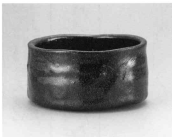
瀬戸黒茶碗 昭和8年 当館蔵