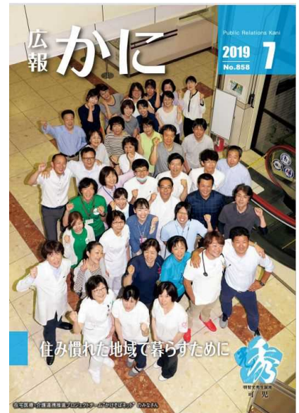
【広報かに 令和元年7月号】