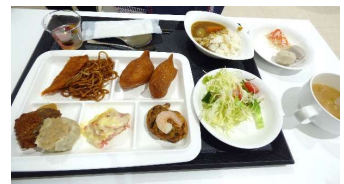
いただきまーすっ！