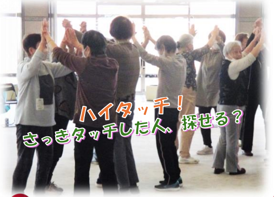
ハイタッチ！ さっきタッチした人、探せる？

30から1まで順番に数を数えながら足踏みもします。これが結構難しい・・・集中力も必要です！