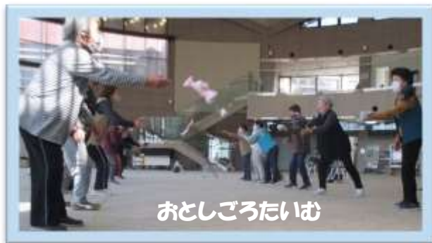
おとしごろたいむ