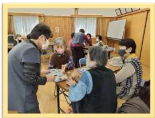
移動喫茶の様子(村木サロン-第3金) 村木以外の方もご参加くださいね〜♪

笑い過ぎてお腹がイタイ、おとしごろたいむは、笑いながら無理なく身体を動かします。いい汗かこう！