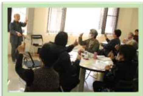
歌声喫茶の様子 一味違う？手遊び&脳トレも！

三月二日に行われたコンサートは、能登半島や東日本の被災地へ届けとたくさんの方が集まってくれました。義援金も「能登半島へ八四七二八円」「東日本へ三五四六円」集まりました。能登半島へは日赤岐阜県支部・東日本へは桜ライン三ーに寄付しました。