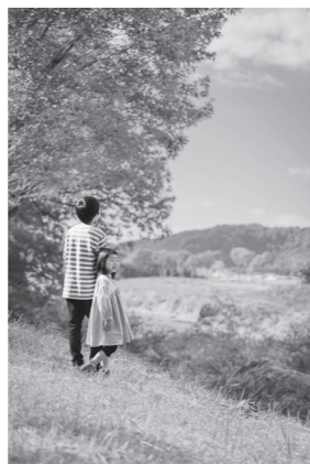
昨年のグランプリ作品