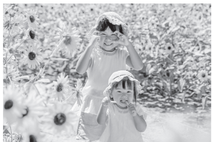
昨年のスマイル部門受賞作品