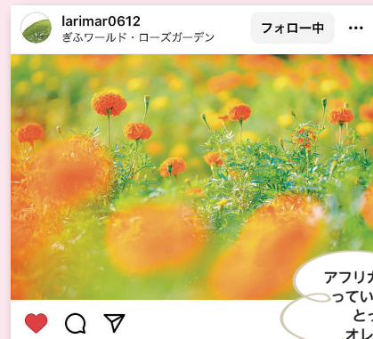
アフリカンマリーゴールド っていう花なんだって♪ とっても鮮やかな オレンジ色ですね! ✨

可児市で見つけた素敵な場所や 思い出の場所、おいしい食べ物も、 #かにスタ をつけて投稿しよう!