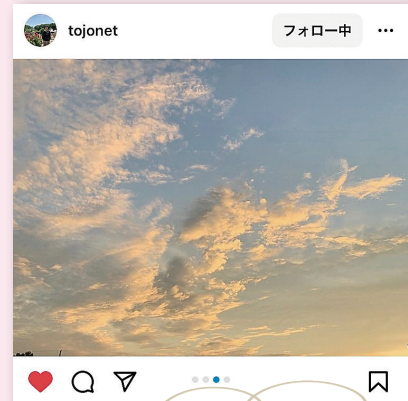
雲がオレンジ色に 光っていてステキ! ✨ 1日の終わりに、 ほっとできる空ですね ☺