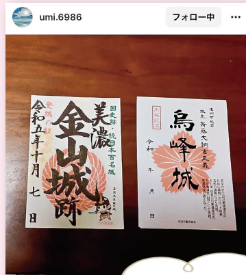
兼山で入手した御城印! 行楽シーズンに兼山を 散策してみませんか!